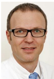
PD. Dr. med. J. Kircher UKlinik Fleetinsel Hamburg